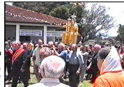
18/01/2004 Processione e festa in Jundiapéba - S. Paolo (Brasile)