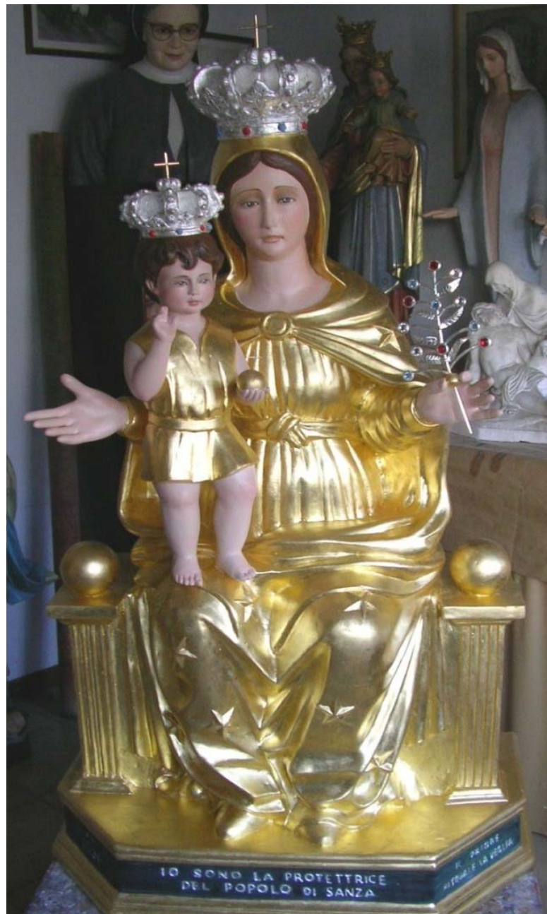
statua della Madonna del Cervato

Chiesa di Santo Cristo Lanùs (Este) Argentina