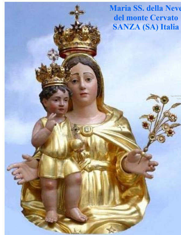
Maria SS. della Neve del monte Cervato SANZA (SA) Italia

Chiesa di Santo Cristo Lanùs (Este) Argentina