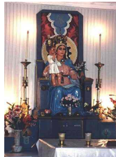
Cappella e statua della Vergine della Neve in Santa Fe (Argentina)