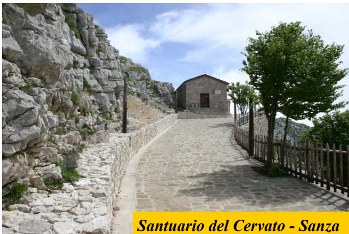
Santuario del Cervato - Sanza

Nel 1618 l'Ordine dei Minori Osservanti Francescani chiese alla Congrega la cessione dell'ospedale e una porzione del giardino adiacente, per potervi erigere, al loro posto, un convento. La Congrega cedette quanto le era stato chiesto, richiedendo solamente che il convento pigliasse il nome di Santa Maria della Neve. Nello stesso anno furono eretti in chiesa madre la cappella e l'altare dedicati alla Madonna della Neve.