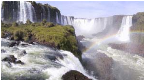
Las Cataratas de Iguazu

La capitale è adagiata sulla riva destra del Rio de la Plata e conta 2.902.000 abitanti circa. Nel 1535 Pietro di Mendoza gettò le fondamenta di Santa Maria di Buenos Aires. A poco a poco gli spagnoli riuscirono ad instaurare il proprio dominio prima sulle rive dei fiumi navigabili e poi nell'interno. Nel 1617 divenne sede del Governatore del Rio de la Plata, nel 1776 capitale del vicereame e nel 1880 capitale del nuovo stato indipendente.