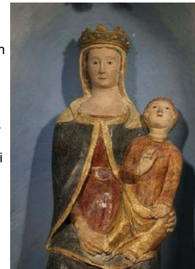
Statua restaurata della Madonna della Grotta sul monte Cervato

Nello stesso anno si ebbe la bella pavimentazione del tratto di strada che dagli