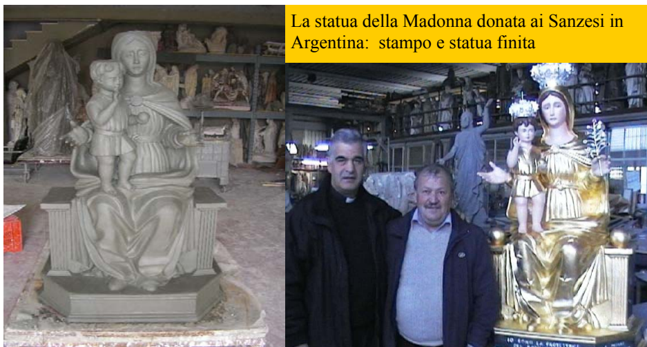
La statua della Madonna donata ai Sanzesi in Argentina: stampo e statua finita