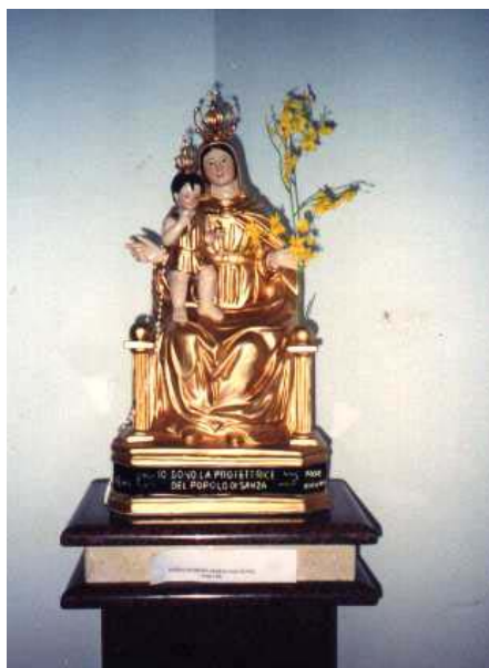
Attuale statua della Madonna della Neve in Jundiapéba - S. Paolo (Brasile)